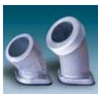
Avtapping (slange, BSP, NPT)