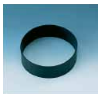
Flens med lav avsuging