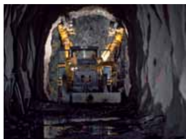
Gruvedrift og tunnelbygging