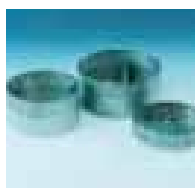
Siler i rustfritt stål

WEDA 10 har en kostnadseffektiv tetningsløsning.